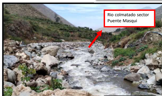
Rio colmatado sector Puente Masqui