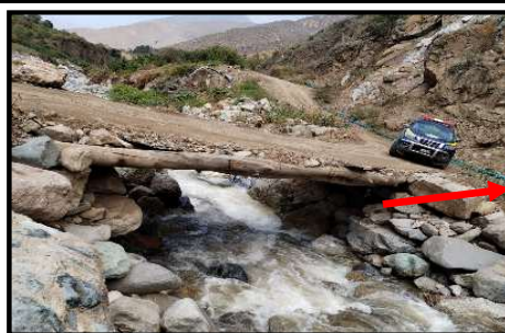
Rio colmatado sector Puente