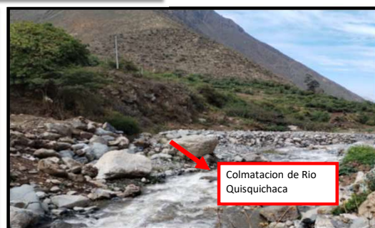
Colmatacion de Rio Quisquichaca